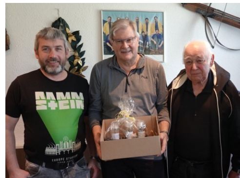
3. Team Mars