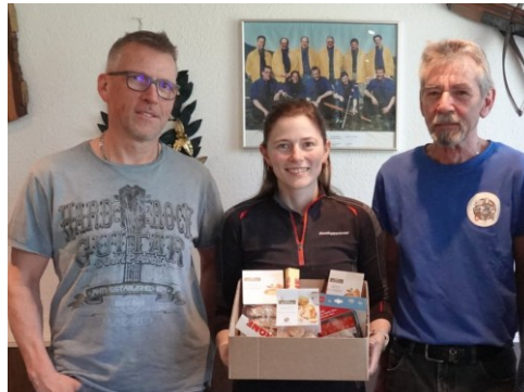
1. Team Merkur